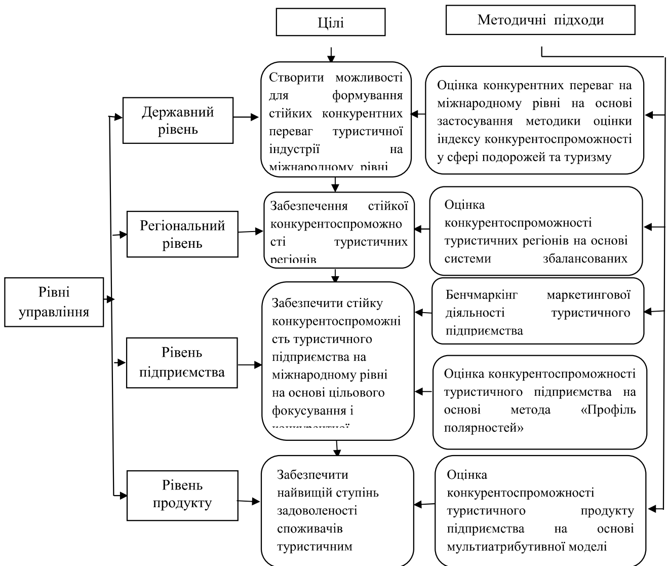
Рис. 3.10. Рівневий підхід до управління конкурентоспроможністю туристичної індустрії на міжнародному ринку туристичних послуг