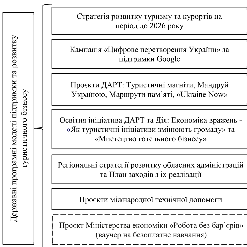
Рис.3.2. Державні програми підтримки розвитку туристичного бізнесу

Державні програмні моделі підтримки розвитку туристичного бізнесу в Україні створюють сприятливі умови для стимулювання економічного зростання завдяки фіскальній та монетарній політиці (податкові пільги, вигідні кредитні умови, грантова та донорська підтримка), розвитку інфраструктури та цифрової трансформації, зростанню рівня зайнятості населення (у сфері туризму та суміжних галузях) (рис.3.2).