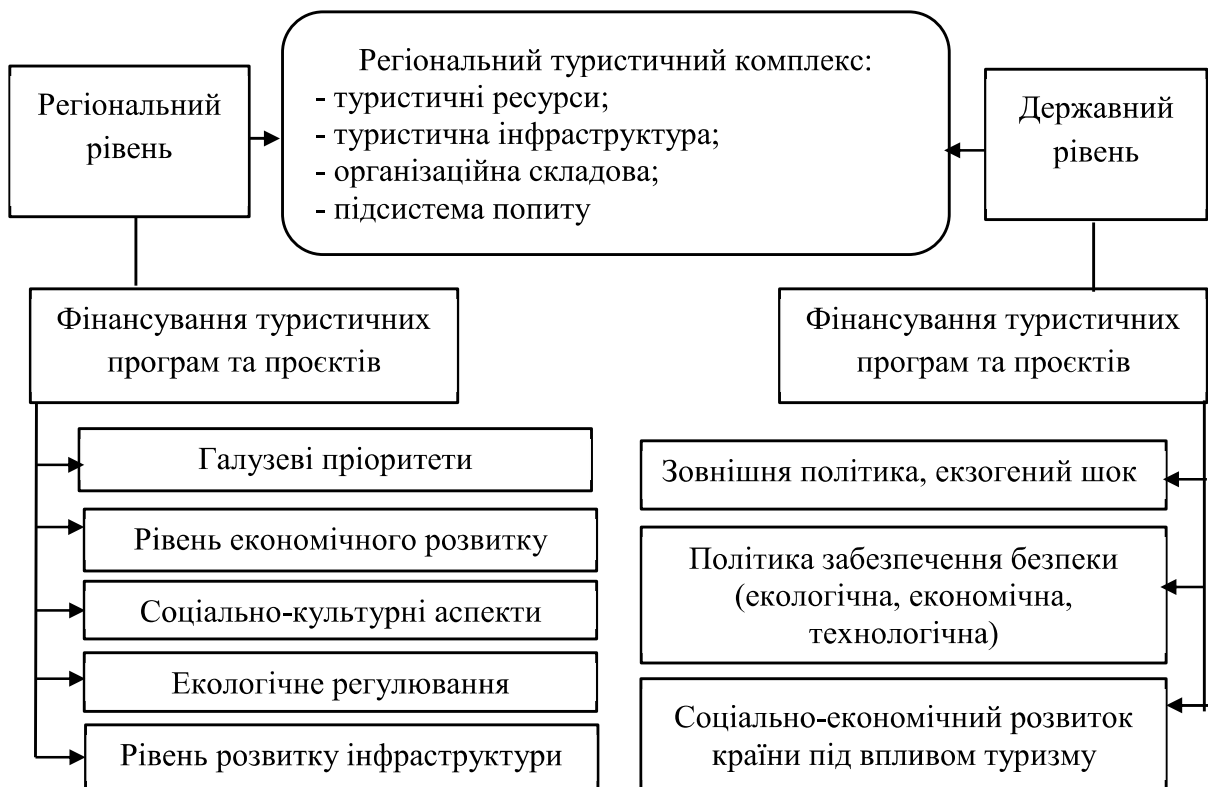
Рис. 3.3. Фактори, що впливають на фінансування туристичних програм та проєктів

Розглянемо фактори, що впливають на фінансування туристичних програм та проєктів (рис.3.3).