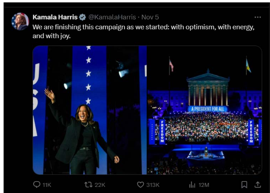
Рис. «Скріншот зі сторінки соціальної мережі X кандидатки у Президенти США Камали Гарріс»

Ці приклади показують, як глобалізація та новітні технології змінюють дипломатичний протокол та державний церемоніал, роблячи їх більш гнучкими та адаптивними до сучасних умов. Дотримання протоколу залишається важливим елементом міжнародних відносин, але його форми та методи змінюються відповідно до нових викликів та можливостей. Це дозволяє забезпечити ефективну комунікацію, зміцнювати політичні зв'язки та уникати конфліктів у глобалізованому світі[47].