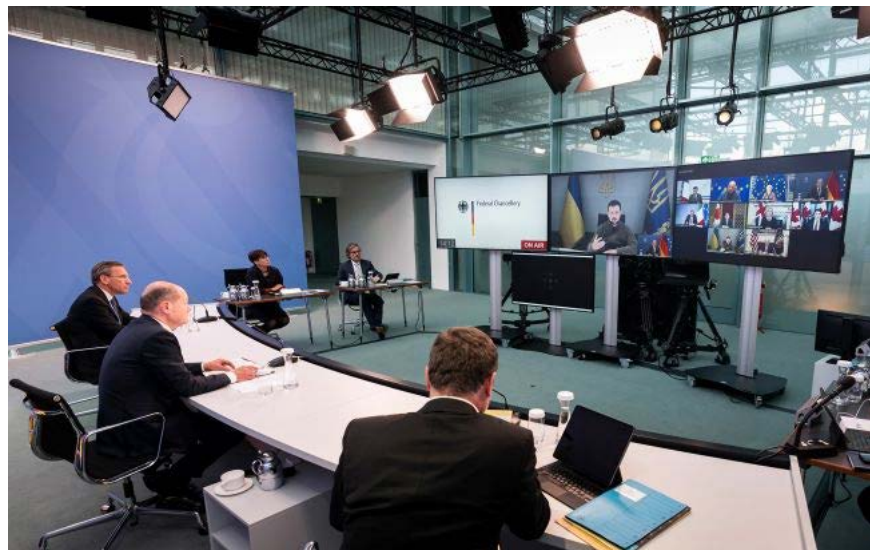
Рис. 3 «Онлайн саміт G7, 12 грудня 2022 року»

Під час війни в Україні 2022 року лідери країн G7 провели серію онлайн-самітів, на яких обговорювали підтримку України та запровадження санкцій проти Росії. Ці зустрічі стали важливими для координації міжнародних зусиль у відповідь на агресію. Окрім того, постійні представники країн-членів ООН регулярно збиралися в онлайн-форматі, щоб обговорити гуманітарну допомогу та захист прав людини в Україні. Такі ініціативи підтверджують солідарність міжнародної спільноти та готовність допомагати в кризовий час.