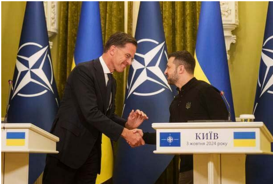
Рис. «Зустріч Президента України Володимира Зеленського з Генеральним Секретарем НАТО Марком Рютте»

Іншим прикладом є конфліктні ситуації, які виникають через порушення протоколу. Нещодавній приклад дипломатичного інциденту стався у вересні 2024 року між Пакистаном та Афганістаном. Під час офіційного заходу в місті Пешавар афганський консул Мохібулла Шакір залишився сидіти під час виконання національного гімну Пакистану. Це викликало обурення в Пакистані та призвело до офіційного протесту з боку пакистанського уряду[100].