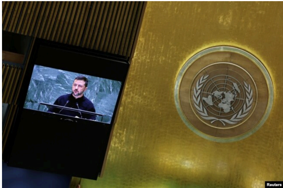
Рис. 2 «Зустріч Президента України Володимира Зеленського Генеральній Асамблеї ООН»

Війна також створює виклики для комунікаційної стратегії дипломатичних представництв. Дипломати повинні ефективно донести позицію своєї держави до міжнародної спільноти та забезпечити підтримку з боку інших країн. Це вимагає нових підходів до комунікації, включаючи використання сучасних технологій та соціальних медіа. Наприклад, Міністерство закордонних справ України активно використовує Twitter та Facebook для інформування світової спільноти про ситуацію в країні та мобілізації міжнародної підтримки[2].