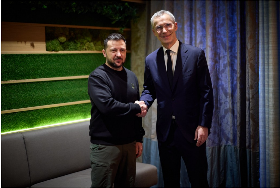
Рис.1 «Зустріч Президента України Володимира Зеленського з Генеральним секретарем НАТО Єнсом Столтенбергом»

Також, під час кризових переговорів щодо евакуації мирних жителів з Маріуполя у 2022 році, дипломати приймали рішення в умовах постійних змін на фронті, що вимагає високої готовності та адаптивності.