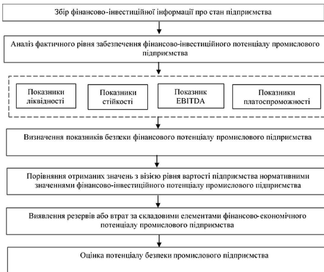
Рис. 1. Модель оцінки потенціалу безпеки підприємства (складено автором)

Необхідність побудови моделі пов'язана з тим, що розраховані коефіцієнти повинні узгоджуватись із стратегічним баченням рівня вартості підприємства, що є важливим для власника бізнесу та його контрагентів. При цьому необхідно зазначити, що комплексна оцінка вартості бізнесу є ресурсовитратним процесом і не є головною ціллю в оцінці потенціалу безпеки підприємства. Для останнього необхідно визначити базовий набір показників вартості бізнесу, які стануть індикативами механізму забезпечення економічної безпеки.