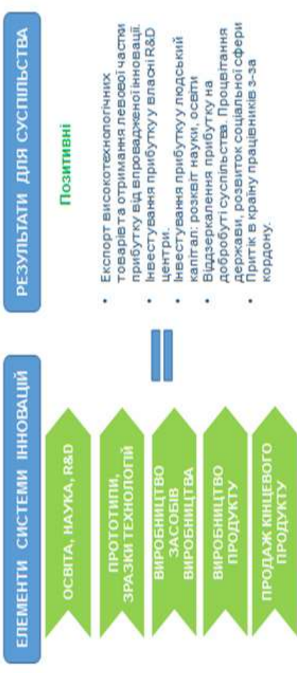
Рис. 3. Замкнутий цикл інновацій: ідеальна модель координації всіх ланок інноваційної системи

Лише замкнений цикл інновацій дає джерела прибутку для довготермінового сталого відтворення інноваційної системи і процвітання суспільства