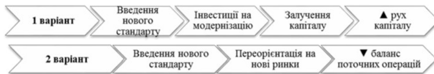
Рис. 2. «Вплив запровадження нових стандартів на баланс поточних операцій та баланс руху капіталу країни-експортера»

варто розглянути й вплив запровадження нових стандартів на її баланс поточних операцій та баланс руху капіталу. Наочно дану картину демонструє рис. 2.