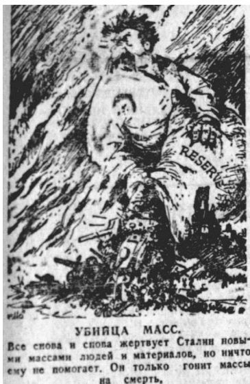
Мал. 4. Донецкий вестник, 4 августа 1943 г.

Другою за популярністю темою карикатур газети «Донецкий вестник» була внутрішня політика СРСР. На шпальтах окупаційної преси не стільки висміювалась, як засуджувалась антирелігійна та антиукраїнська політика Сталіна, колективізація та пов'язані з ними репресії. Сталін зображувався як здоровезний орел із величезними вусами та утрираними рисами обличчя, що підкреслювали його національність (читай – інакшість) (мал. 4), поставав у вигляді кровожерливого м'ясника, який для досягнення своїх цілей знищує народ (мал. 5). Супроводом подібних карикатур часто-густо виступали приклади народного (ймовірніше, авторського) 12 фольклору – антирадянські частівки, прислів'я, загадки.