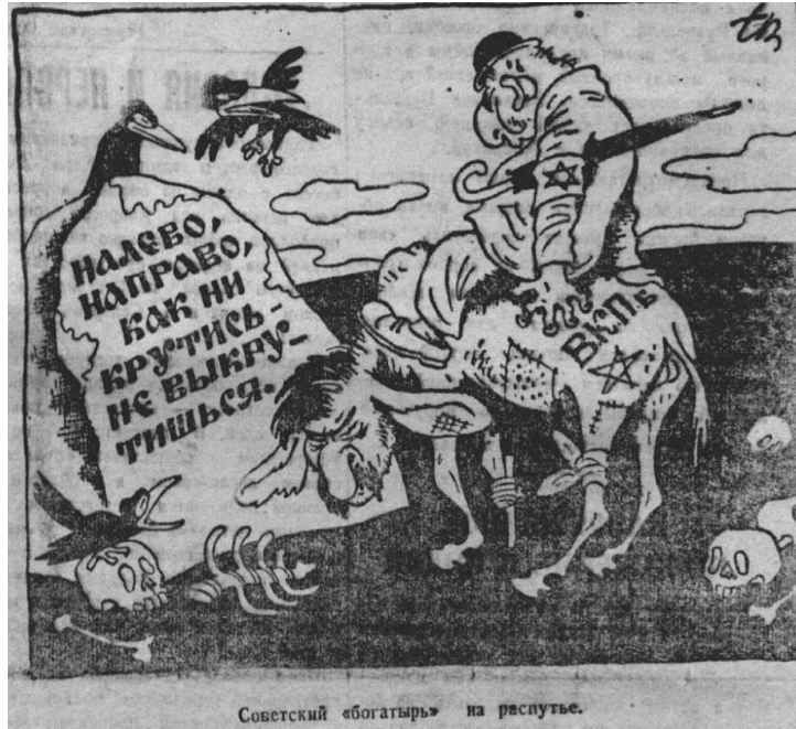
Мал. 7. Донецкий вестник, 6 сентября 1942 г.

Як зазначалося вище, одним із головних питань, яке ставить дослідження, чи була політична карикатура на шпальтах окупаційної преси дієвою та чи мала той вплив на населення, який передбачався окупантами. На жаль, наявні джерела не дозволяють дати вичерпні відповіді на ці запитання. На території окупації періодичні видання були чи не єдиним джерелом інформації для населення, вакуум якої поповнювався саме з відомостей наявної преси. І все ж населення досить скептично ставилося до змісту окупаційної преси — «німецькі газети брешуть ще більше за радянські» 13 . Інша справа карикатура. За висновком відомого дослідника політичного гумору А. В. Дмитрієва, «через використання візуального каналу впливу або критично націленого на окрему важливу тему символу політична карикатура стає дієвим засобом формування суспільної думки. Її апеляції до емоцій взагалі важко протистояти, і її вплив доволі помітний до теперішнього часу» 14 . Але карикатура