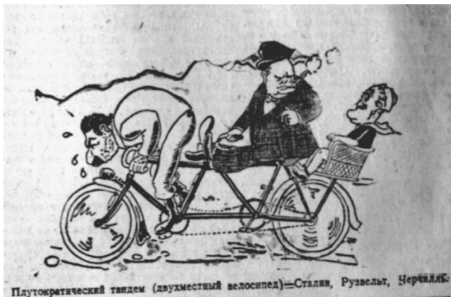
Мал. 2. Донецкий вестник, 1 августа 1943 г.

У зображеннях карикатуристів Черчилль, Рузвельт та Сталін часто сварились, підставляли один одного. Водночас постійно акцентувалося на принизливому становищі Сталіна порівняно з його союзниками, що у карикатурах відбивалося зображенням Сталіна завжди в нижній частині малюнка щодо Рузвельта та Черчилля (мал. 2). Зважаючи, що одним із найпопулярніших сюжетів карикатур був другий фронт (мал. 3), то цілком зрозумілим є нав'язування у свідомості населення окупованих територій теми розбрату між союзниками, щоб виключити надії навіть на можливість домовленостей про спільні дії.