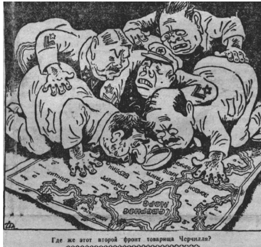
Мал. 3. Донецкий вестник, 23 августа 1943 г.

Другою за популярністю темою карикатур газети «Донецкий вестник» була внутрішня політика СРСР. На шпальтах окупаційної преси не стільки висміювалась, як засуджувалась антирелігійна та антиукраїнська політика Сталіна, колективізація та пов'язані з ними репресії. Сталін зображувався як здоровезний орел із величезними вусами та утрираними рисами обличчя, що підкреслювали його національність (читай – інакшість) (мал. 4), поставав у вигляді кровожерливого м'ясника, який для досягнення своїх цілей знищує народ (мал. 5). Супроводом подібних карикатур часто-густо виступали приклади народного (ймовірніше, авторського) 12 фольклору – антирадянські частівки, прислів'я, загадки.