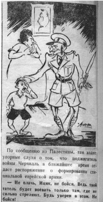
Мал. 6. Донецкий вестник, 11 июня 1942 г.

Ще одним із сюжетів, який викривався політичною сатирою, був антисемітизм. Антисемітська пропаганда займала доволі значне місце на шпальтах видання, проте, що стосується карикатур, то антисемітських сюжетів у «Донецкому вестнику» набагато порівняно з іншими, до того ж вони зазвичай були супровідними. Наприклад, карикатура, яка висміювала начебто створення єврейського полку в армії Великобританії (мал. 6). Антисемітизм не пропагувався на побутовому рівні, критикувалось «жидо-більшовицьке» походження радянської влади та не єврей Сталін, який співпрацював з євреями проти свого ж народу (мал. 7).