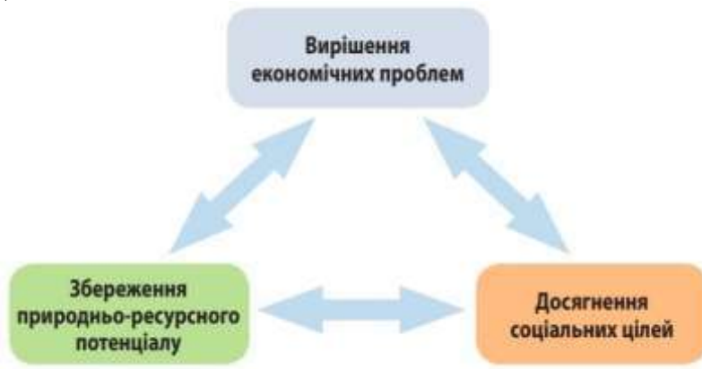
Рис. 1. Модель екологічно орієнтованого соціального підприємництва

Екологічно орієнтовані підприємства, крім турботи про довкілля, активно працюють над вирішенням соціальних проблем, спрямовуючи свою діяльність на досягнення позитивних соціальних результатів (рис. 1).