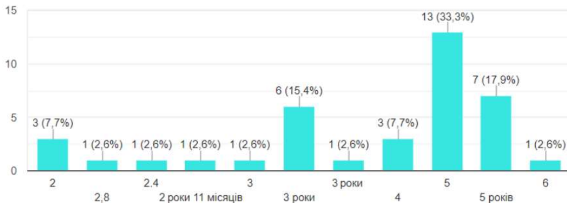
Рис. 2. Вік дітей дошкільного віку

Отже, батьки сприймають ризик в ігровій поведінці дітей, у тому числі їхнє самостійне пересування. Рівень ризикованості ігрової