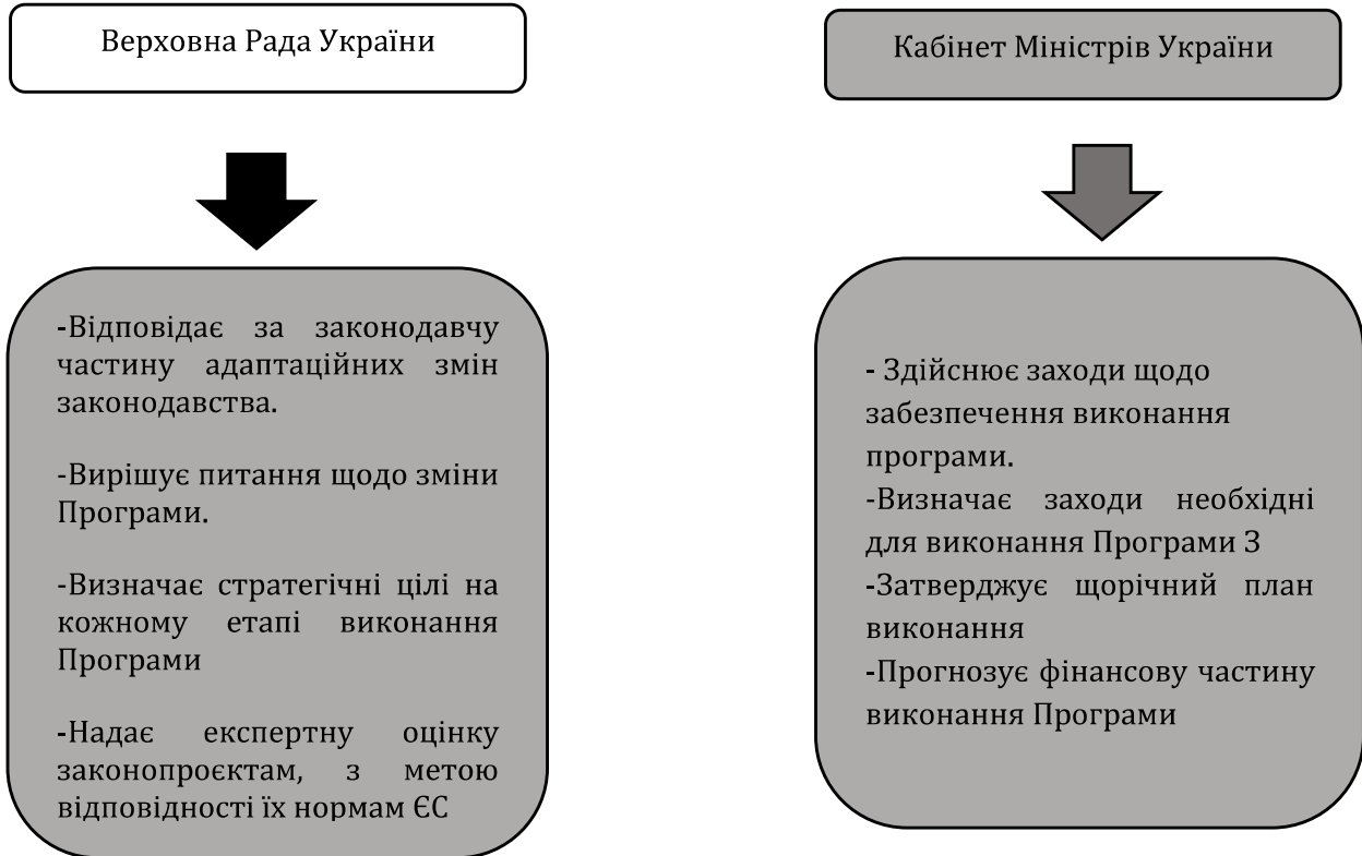
Рис. 1 Інституціональні механізми адаптації

Вказаним законом визначені й інституціональні механізми адаптації європейського законодавства у розрізі законодавчої та виконавчої гілок влади. На рисунку 1 можемо розглянути такі механізми.