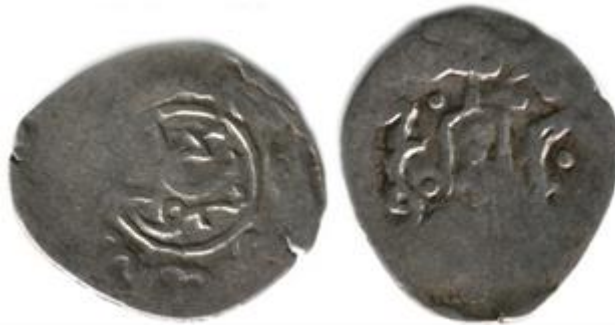
Рис 2. Данг хана Мухаммада б. Тимура з ім'ям Махмуда на реверсі, 0.71 г.

Подібний випадок, безпрецедентний у джучидській нумізматиці, може бути пояснений припущенням, що Кічі-Мухаммад намагався таким чином зміцнити претензію на трон свого десяти-одинадцятирічного сина, а саме цю групу монет може бути датовано приблизно серединою 1440-х років.