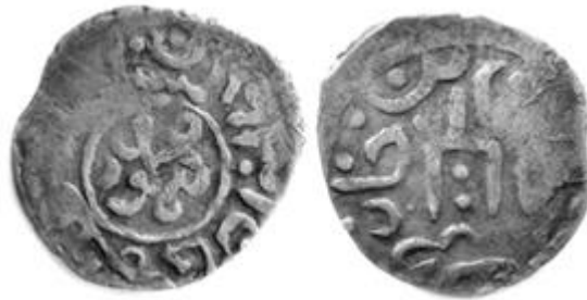
Рис 1. Данг хана Мухаммада б. Тимура, Хаджі-Тархан, 831 р.х., 0.62 г.

Р.Ю. Почекаєв у другому виданні (2012 року) своєї праці «Царі ординські. Біографії ханів і правителів Золотої Орди» вважає, що «останні монети хана Кічі-Мухаммеда ... відносяться до 1459 р. Ймовірно, в тому ж році він помер, і до влади прийшли його сини Махмуд і Ахмад» [16, с. 253]. На жаль, Р.Ю. Почекаєв не пояснив які саме монети Мухаммада б. Тимура та чому він відніс їх до 1459 року. Автор вважає, що на нинішньому рівні наших знань таке датування будь-якої емісії цього хана неможливе, єдиний відомий датований випуск Мухаммада б. Тимура (конче важливий, до речі, для визначення часу початку правління цього джучида) був здійснений в Хаджі-Тархані і несе на аверсі дату 831 р.х. (Рис. 1).