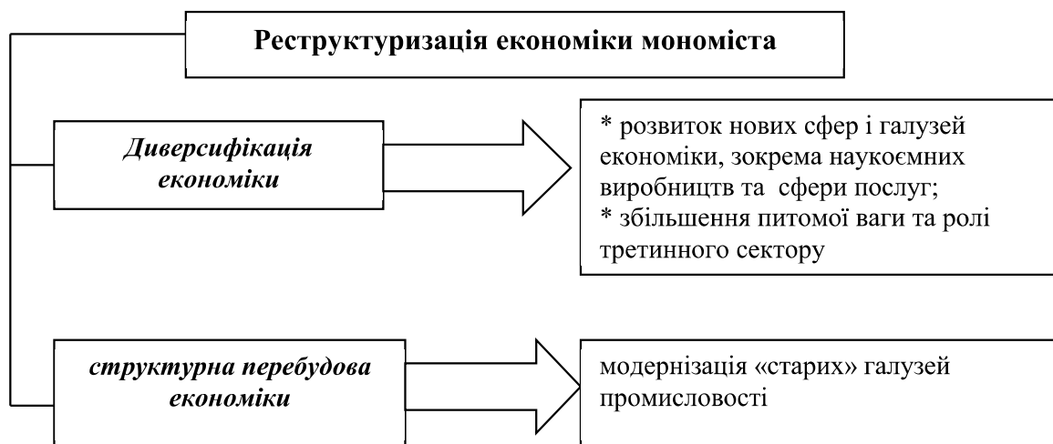
Рис. 1. Шляхи реструктуризації економіки мономіста

Узагальнення зарубіжного досвіду показує, що диверсифікація зазвичай проходить двома шляхами: диверсифікація економіки за рахунок розвитку нових галузей або модернізація наявних виробництв (рис. 1) [3].