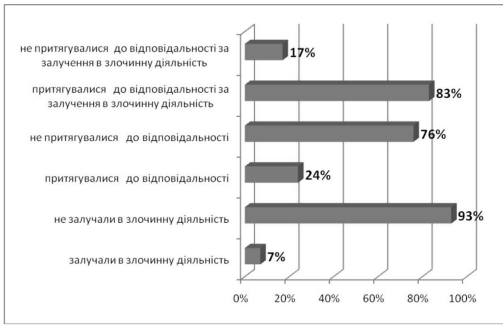
Мал. 1. Протиправна поведінка батьків як детермінанта злочинності неповнолітніх

Також ми намагалися визначити причини агресивної поведінки неповнолітніх, оскільки існує зв'язок між різними характеристиками сім'ї та можливістю розвитку агресивної поведінки. Адже така поведінка веде до вчинення таких злочинів, як убивство, заподіяння тілесних ушкоджень різного ступеня тяжкості,