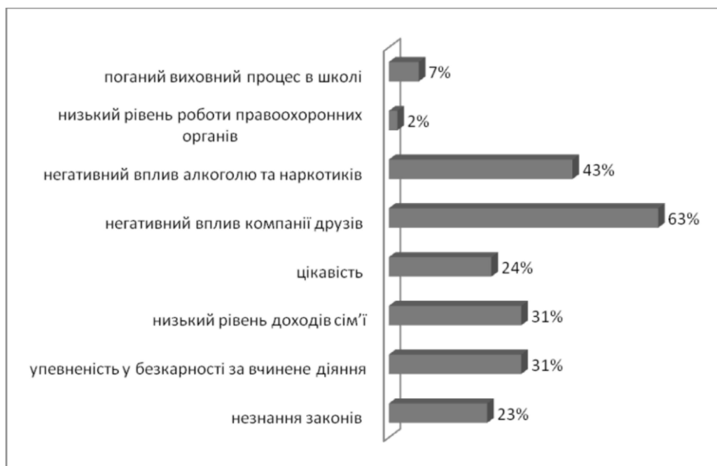
Мал. 3. Основні чинники, які обумовлюють учинення злочинів підлітками

Висновки. Незважаючи на відсутність магічних рішень щодо запобігання дитячій злочинності або її подолання, визначення основних чинників, які зумовлюють вчинення злочинів неповнолітніми, є необхідною складовою в загальній структурі боротьби зі злочинністю. Особливо цікавою є думка тих осіб, які вже вчинили злочин. Проведене нами дослідження показало, що основними умовами і причинами вчинення злочинів підлітками, на їхню думку, є негативний вплив друзів (63%), алкоголю (43%), упевненість