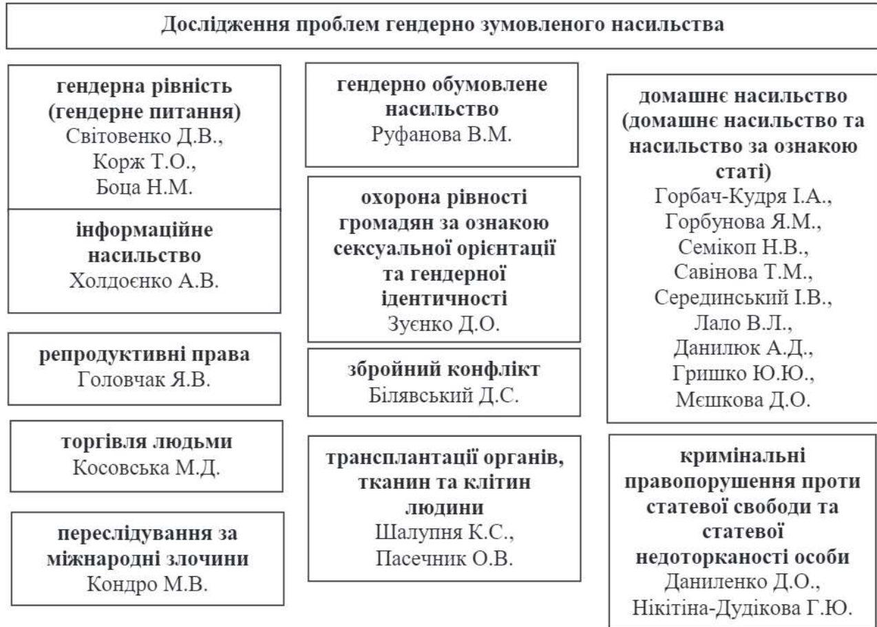
Рис. 2. Структура наукової проблематики гендерно зумовленого насильства, розподілена за напрямками досліджень українських вчених у 2020 році

реалізації гендерної рівності Національною поліцією України». Зокрема, вченою доведено обґрунтованість і практичну необхідність дотримання міжнародних стандартів та використання Україною передового зарубіжного досвіду реалізації адміністративно-правових механізмів гендерної політики органами поліції: послідовна криміналізація різних форм насильства за гендерною ознакою (посилення відповідальності за вчинення насильства, свідком якого є дитина; неможливість уникнення кримінальної відповідальності за вчинення насильства за ознакою гендера повторно); застосування спеціальних електронних GPS-браслетів з метою відстеження та оперативного реагування на наближення кривдника до потерпілої особи; максимальне залучення громадських формувань до виявлення, запобігання та протидії виявам дискримінації за гендерною ознакою [4, с. 22].