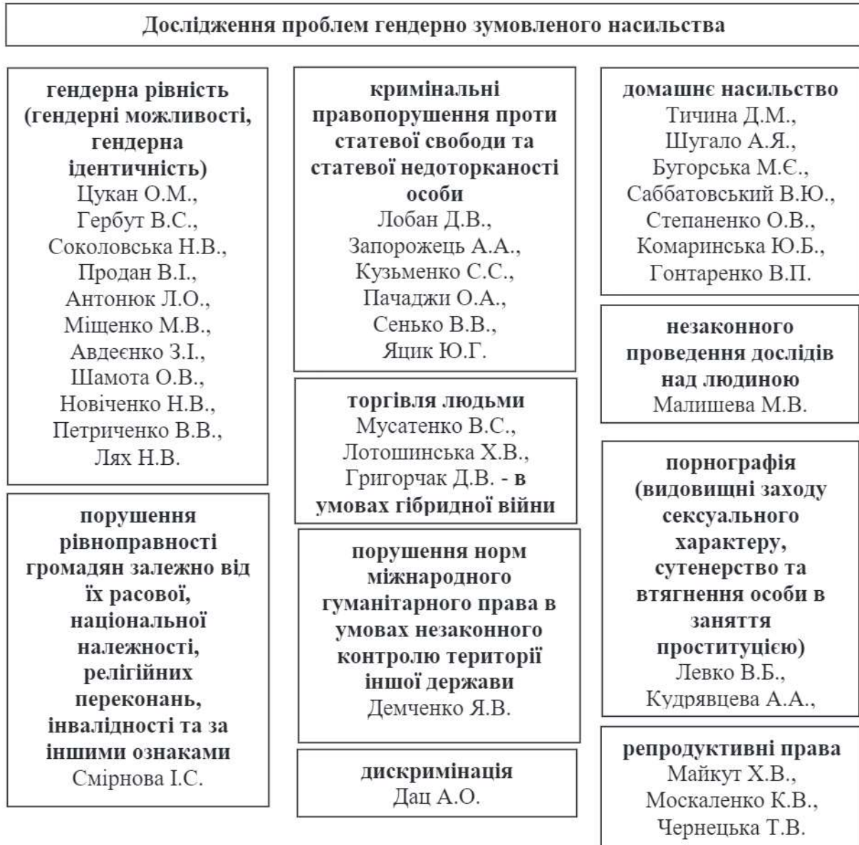
Рис. 3. Структура наукової проблематики гендерно зумовленого насильства, розподілена за напрямками досліджень українських вчених у 2021 році