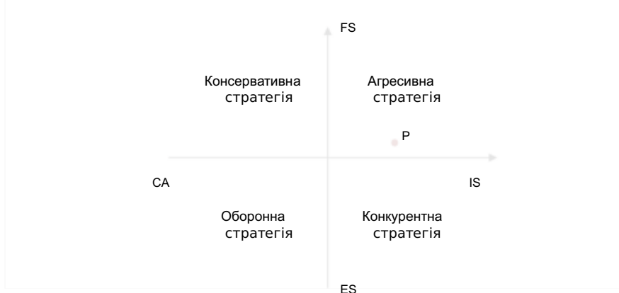
Рис. 3.2. - матриця SPACE