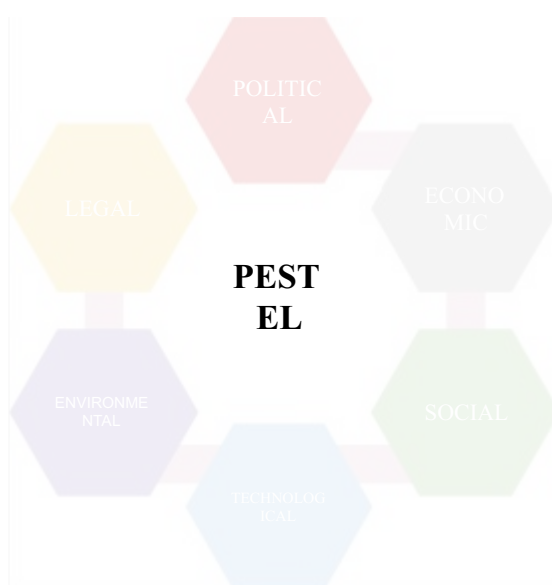
Рис. 1.3. – PESTEL-аналіз

PESTEL-аналіз (рис 1.3.). Оцінює політичні (Political), економічні (Economic), соціальні (Social), технологічні (Technological), екологічні (Environmental) та правові (Legal) фактори, що впливають на діяльність організації.