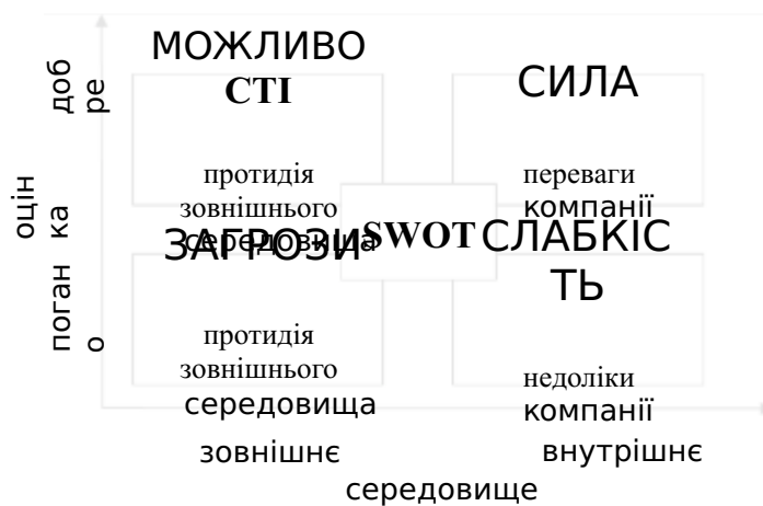
Рис. 1.1. – Матриця SWOT-аналізу

VRIO-аналіз (рис 1.2.). Оцінює ресурси та можливості організації за критеріями цінності (Value), рідкості (Rarity), можливості імітації (Imitability) та організації (Organization). Цей підхід допомагає визначити конкурентні переваги.