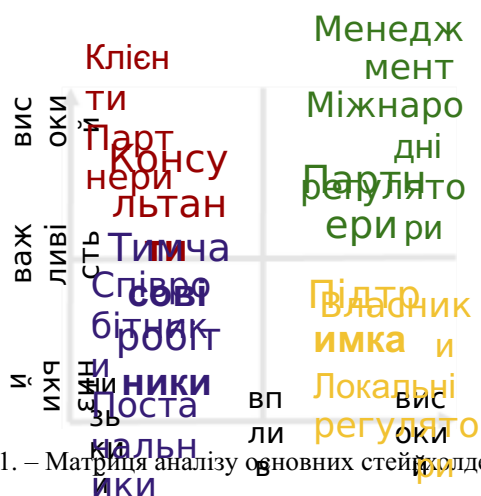
Рис. 3.1. – Матриця аналізу основних стейкхолдерів

Стратегія "Партнери" (Менеджмент та Наглядова Рада) полягає в максимальному залученні відповідних стейкхолдерів в процеси прийняття рішень у проекті, ці види зацікавлених сторін мають найбільший вплив на результати проекту та хід його реалізації. Необхідно підвищувати зацікавленість групи у проекті та повністю задовольняти їх потреби. Рекомендується використовувати принцип партнерства у комунікації під час переговорів щодо проекту з цією групою.