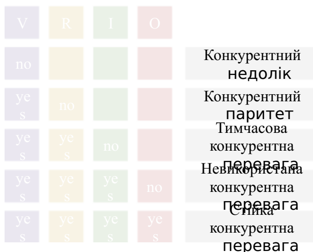
Рис. 1.2. – Матриця VRIO-аналізу

VRIO-аналіз (рис 1.2.). Оцінює ресурси та можливості організації за критеріями цінності (Value), рідкості (Rarity), можливості імітації (Imitability) та організації (Organization). Цей підхід допомагає визначити конкурентні переваги.