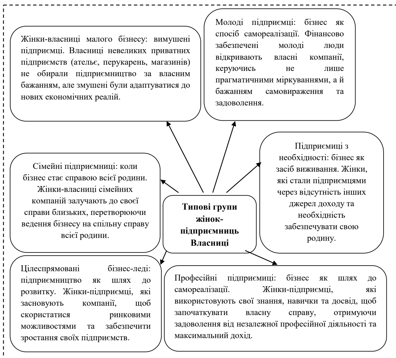
Рисунок 1.1 – Типові групи жінок підприємниць

соціально-економічному розвитку України, особливо в умовах воєнного стану та повоєнного відновлення [2, с. 27].