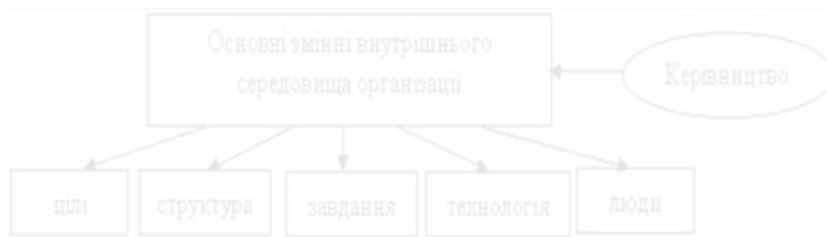
Рис. 1.1 Складові внутрішнього середовища підприємства

1. Цілі. 2. Структура організації. 3. Завдання. 4. Технологія. 5. Люди. (рис.1.1)