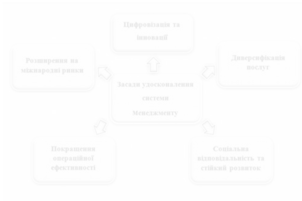
Рис. 3.4. Засади удосконалення системи менеджменту ПАТ КБ «ПриватБанк»