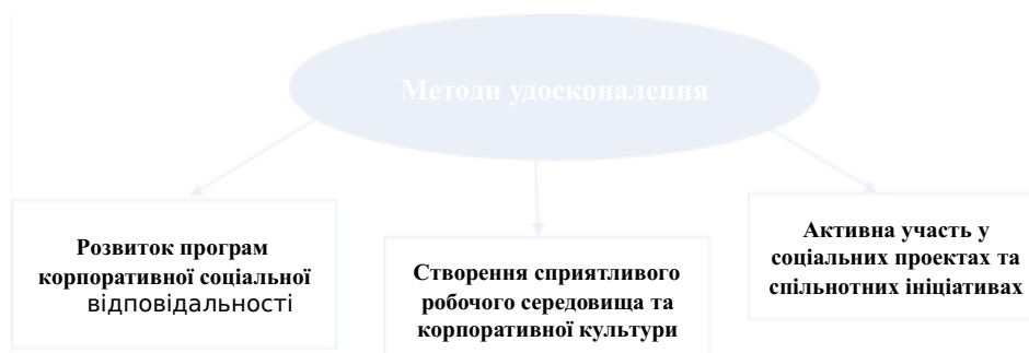
Рисунок 3.1. - Методи удосконалення соціального управління в системі менеджменту

управління, які спрямовані на покращення якості життя співробітників та взаємовідносин зі спільнотою.