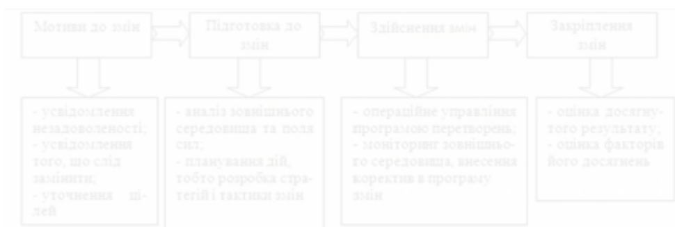
Рис. 3.1. Етапи управління змінами

На ТОВ «Нова Пошта» дуже часто впроваджують сучасні методи управління змінами, вони включають у себе навчання та розвиток персоналу, їх залучення, а також використання KPI для оцінки ефективності впроваджених змін.