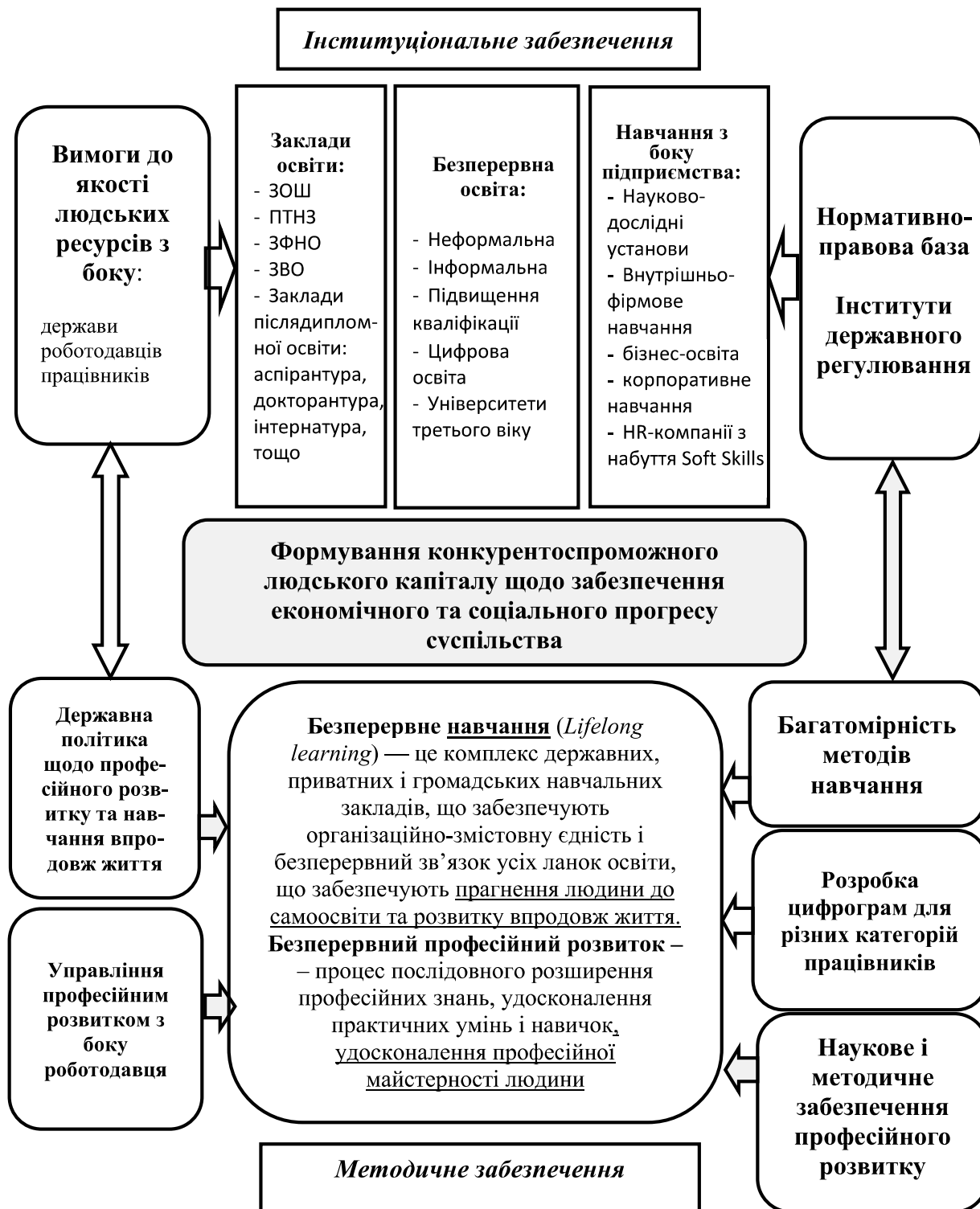
Рис. 3. Структурно-логічна модель системи безперервного навчання та професійного розвитку*

Для представлення загальної картини системи безперервного навчання в Україні розглянемо її структурно-логічну модель (рис. 3).