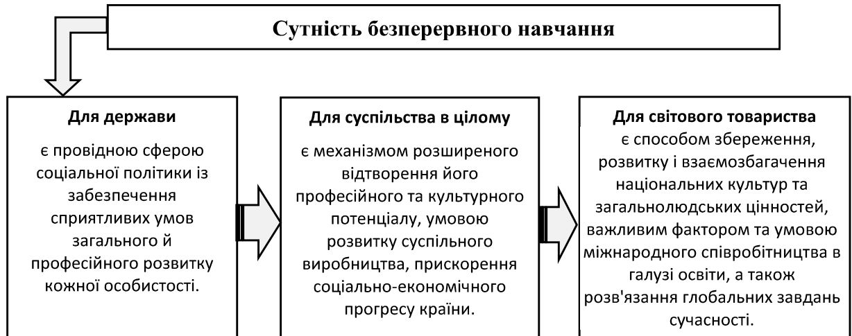
Рис. 1. Сутність безперервного навчання*