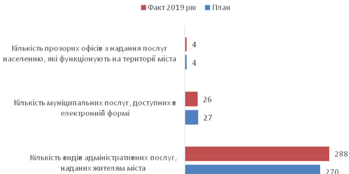
Рис. 1. Динаміка виконання цільових показників за стратегічною програмою «Новий муніципалітет» у 2019 р.