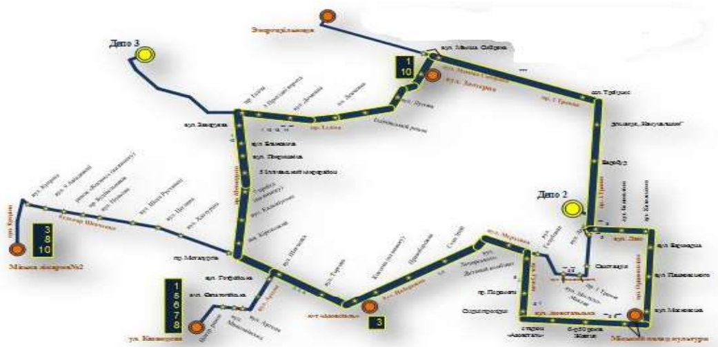
Рис.3 Транспортна мережа м. Маріуполя за проектом «Європейське кільце»

Шляхом вирішення поставлених завдань має стати впровадження і реалізація проекту «Європейське кільце», а саме капітальний ремонт 69 км трамвайної колії та контактної мережі (657,3 млн. грн.); придбання 35 одиниць низькопольних трамваїв та 11 тролейбусів MAN б/у з Німеччини (38,5 млн. грн.), – забезпечення зупинок засобами доступності, створення комфортних умов для очікування муніципального транспорту (5,2 млн. грн.) та технічна модернізація міського трамвайного парку (4,5 млн. грн.).