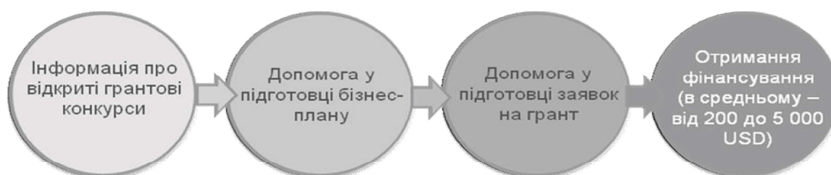
Рис.1 Процес надання практичної допомоги в підготовці проектів

У 2016 році стартував проект «Центр надання адміністративних послуг», що реалізується спільно з USAID. З метою підвищення ефективності рішення проблем соціально незахищених жителів міста ведеться розробка соціальної карти Маріупольця. Так, на базі Центру надання адміністративних послуг буде здійснюватися інформування про можливості грантової підтримки та надання практичної допомоги в підготовці проектів (рис.1).