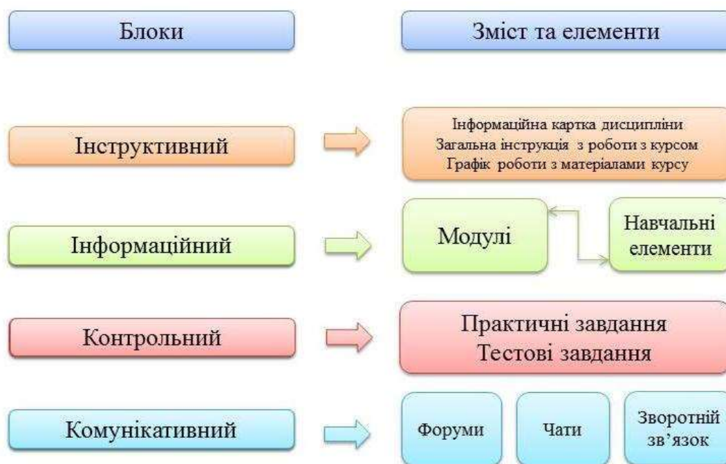
Рис. 3.1 Проєкт сценарію навчального курсу

проблем та завдань. В узагальненому вигляді проєкт сценарію навчального курсу матиме такий вигляд: