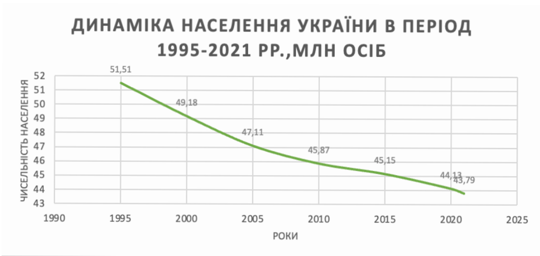
Рисунок 2 Рівень народжуваності і смертності України [1]