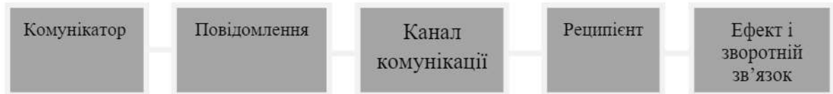
Рис.1. Система ефективної комунікації

стає як самостійний вид менеджменту, котрий забезпечує роботу системи управління, що дозволяє здійснювати усі можливі операції із інформацією, які приведуть організацію до досягнення позитивних результатів в багатьох показниках її ефективності» [1].