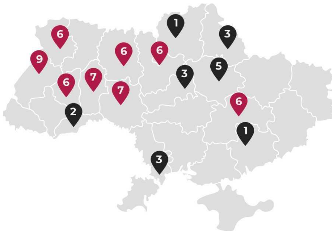
Рис. 2.1. Кількість розглядів справ, пов'язаних із вчиненням домашнього насильства

З представлених даних (Рис.2.1) ми можемо зробити висновок, що ті регіони України, в яких не відбуваються активні бойові дії, мають вищі показники розгляду справ про адміністративне правопорушення, пов'язаного з домашнім насильством. Натомість ті регіони України, в яких відбуваються активні бойові дії або які знаходяться поблизу фронтової зони, мають нижчі показники розглянутих справ, пов'язаних з домашнім насильством.