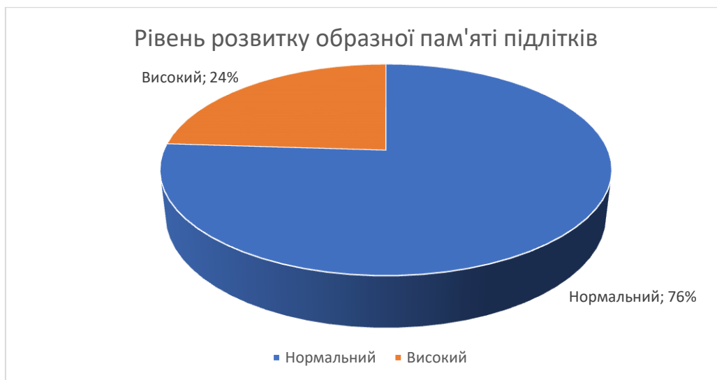
Рис.3.2.1. Рівень розвитку образної пам'яті (за методикою «Пам'ять на образи»)

Отже, враховуючи результати емпіричного дослідження, можемо зробити висновок, що розвиток різних видів пам'яті у групи досліджуваних підліткового віку знаходиться в межах норми, тобто соціальна ситуація не впливає на розвиток пам'яті. Тож, гіпотеза дослідження не підтвердилася.