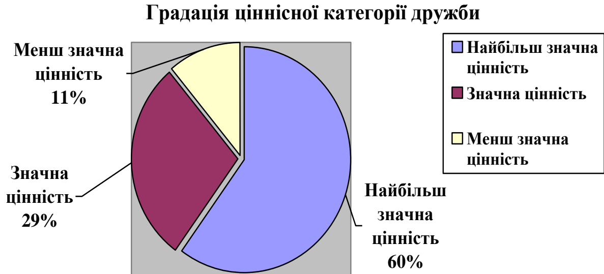
Рис. 3.2.2 Градація ціннісної категорії дружби

Таким чином, можна зробити висновок, що представленість у свідомості Я-образу «Друг» має значення в тому випадку, коли дружба є «Більш значною цінністю». Коли дружба є «Значною цінністю» зв'язок з наявністю Я-образу «Друг» не просто відсутній, він є негативним. Коли дружба є «Менш значною цінністю» наявність або відсутність Я-образу «Друг» значення не має.