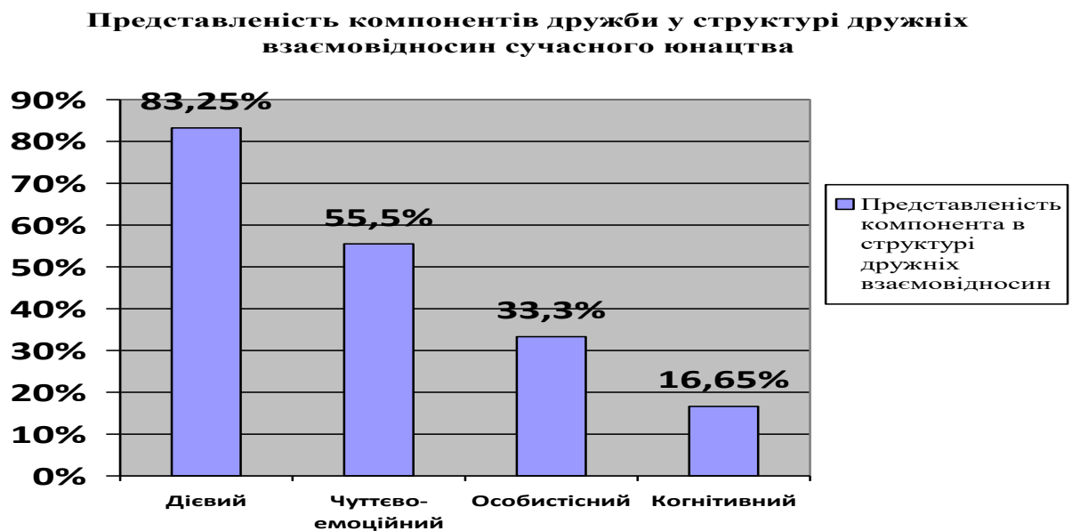
Рис. 3.2.3 Представленість компонентів дружби у структурі дружніх взаємовідносин сучасного юнацтва

«Дієвий» компонент дружніх взаємовідносин присутній в 15 реченнях з 18 (83,25%), «чуттєво-емоційний» компонент присутній у 10 реченнях з 18 (55,5%), «особистісний» компонент присутній у 6 реченнях з 18 (33,3%), «когнітивний» компонент присутній в 3 реченнях з 18 (16,65%) (див.рис.3.2.3)