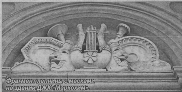
Фрагмент лепнины с масками на здании ДЖК «Маркохим».