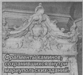
Фрагменты каминов, сохранившиеся внутри мариупольских зданий.

мины были не только элементом системы отопления, но и составляли единое целое с декором всего помещения.