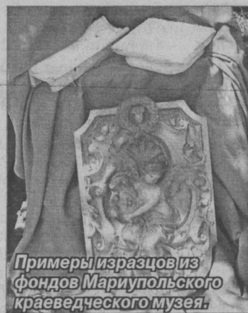
Примеры изразцов из фондов Мариупольского краеведческого музея.