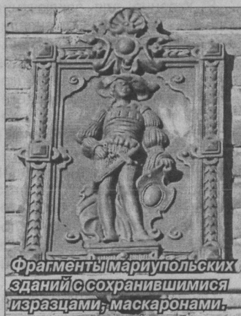
Фрагменты мариупольских зданий с сохранившимися изразцами, маскаронами.

иначе, чем матовые), и в санитарном отношении (матовые поверхности, и особенно глиняные, дают прицепку бактериям и иной пыли, которая потом, при нагреве печи, от циркуляции воздуха вдоль стенок захватывается током и может быть узнана иногда и на обоянии»).