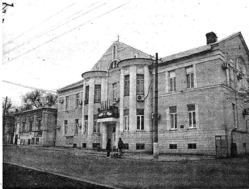
Здание, в котором находилась прогимназия Дарий

зав. сектором информационного обслуживания библиотеки МГГУ