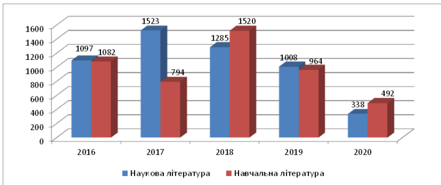
Рис. 1. Надходження наукової та навчальної літератури до наукової бібліотеки МДУ (2016–2020 рр., прим.)

За звітний рік фонд поповнився майже на 1 тис. примірників нових друкованих видань і на початок 2021 року загальний фонд становить понад 164 тис. примірників навчальної, наукової, довідкової та художньої літератури. Комплектування фонду науковими виданнями (41% від загальної кількості нових надходжень) та комплектування виданнями українською мовою (близько 90% від загальної кількості нових надходжень) залишилися пріоритетними напрямками комплектування. Загальний фонд періодичних видань бібліотеки на початок 2021 року нараховує 371 найменування, з них наукових – 217.