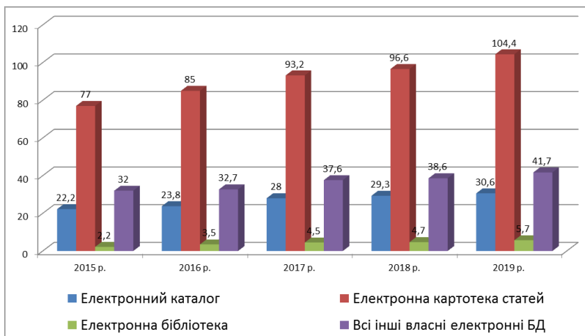
Рис. 2. Власні електронні ресурси наукової бібліотеки МДУ (тис. записів)

Власні електронні інформаційні ресурси бібліотеки створюються на основі інформаційно-бібліотечної програми ІРБІС-64 та складаються з Електронного каталогу, повнотекстової бази даних «Електронна бібліотека НБ МДУ», бібліографічних баз даних «Електронна картотека статей», «Праці викладачів МДУ», «МДУ у засобах масової інформації» та ін. Їх обсяг за звітний рік збільшився майже на 13 тис. записів і на 01.01.2020 становить понад 180 тис. Протягом року було зареєстровано понад 295 тис. звернень до електронних ресурсів бібліотеки.