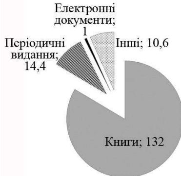
Фонд бібліотеки на 01.01.2015 (тисяч примірників)

У загальному бібліотечному фонді обсяг повнотекстових електронних ресурсів та кількість електронних підручників і посібників, які підготовлені викладачами МДУ, залишається вкрай низьким.