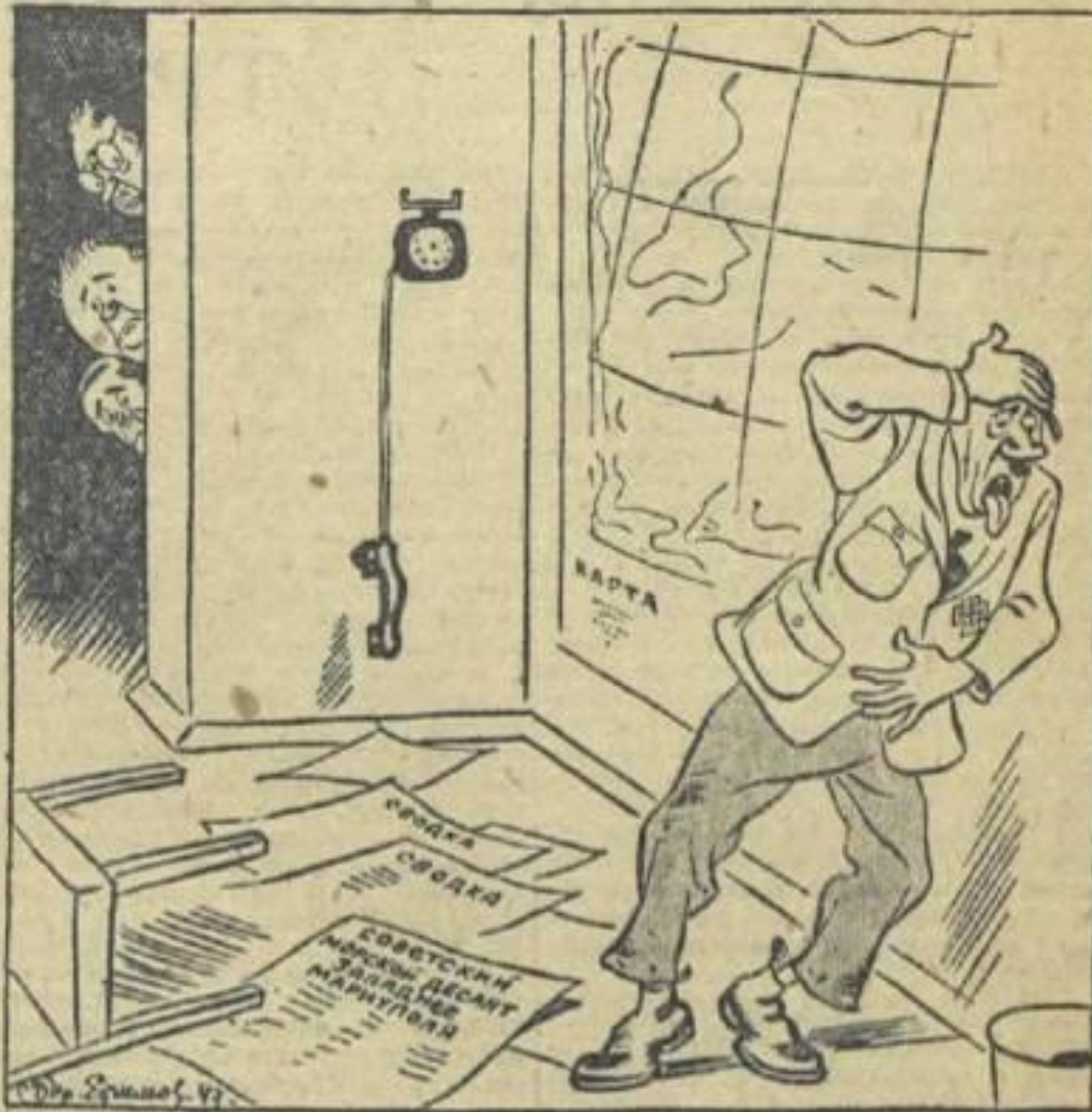
Рис. Бор. Ефимова.