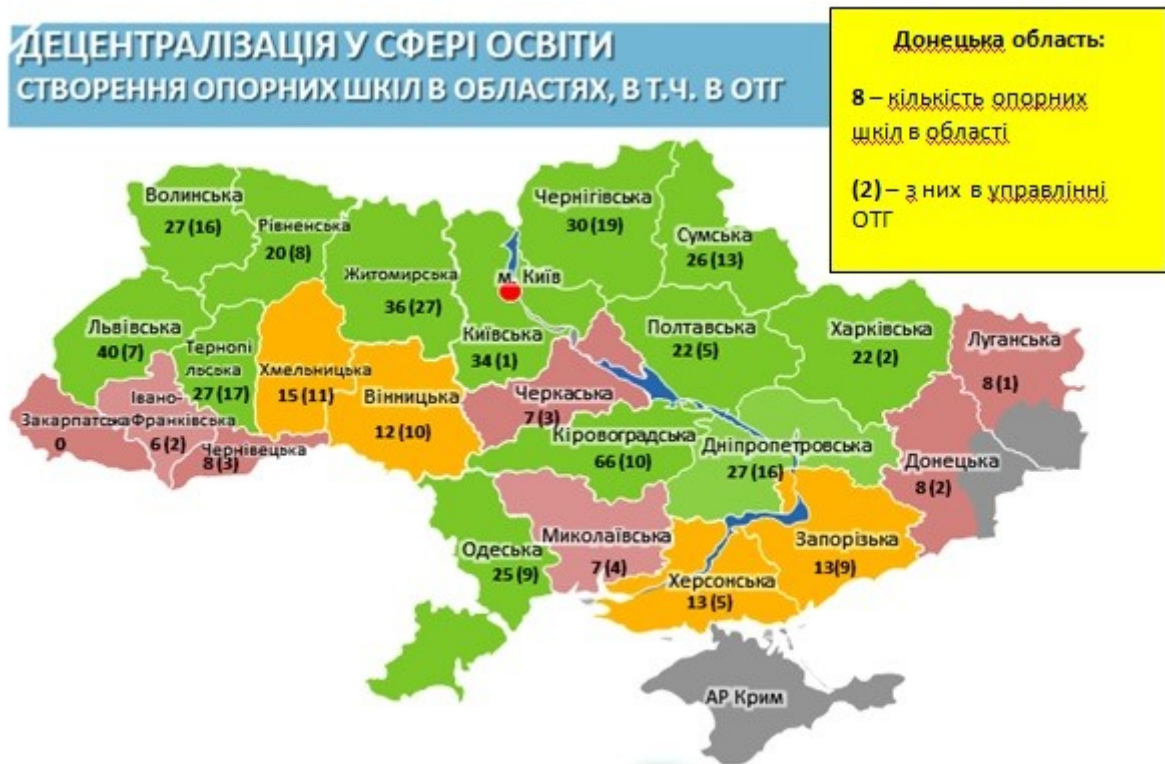
Мал.4. Децентралізація у сфері освіти

Міністерством освіти та науки України, станом на 12.03.2021 рік розроблена діаграма про уявлення.