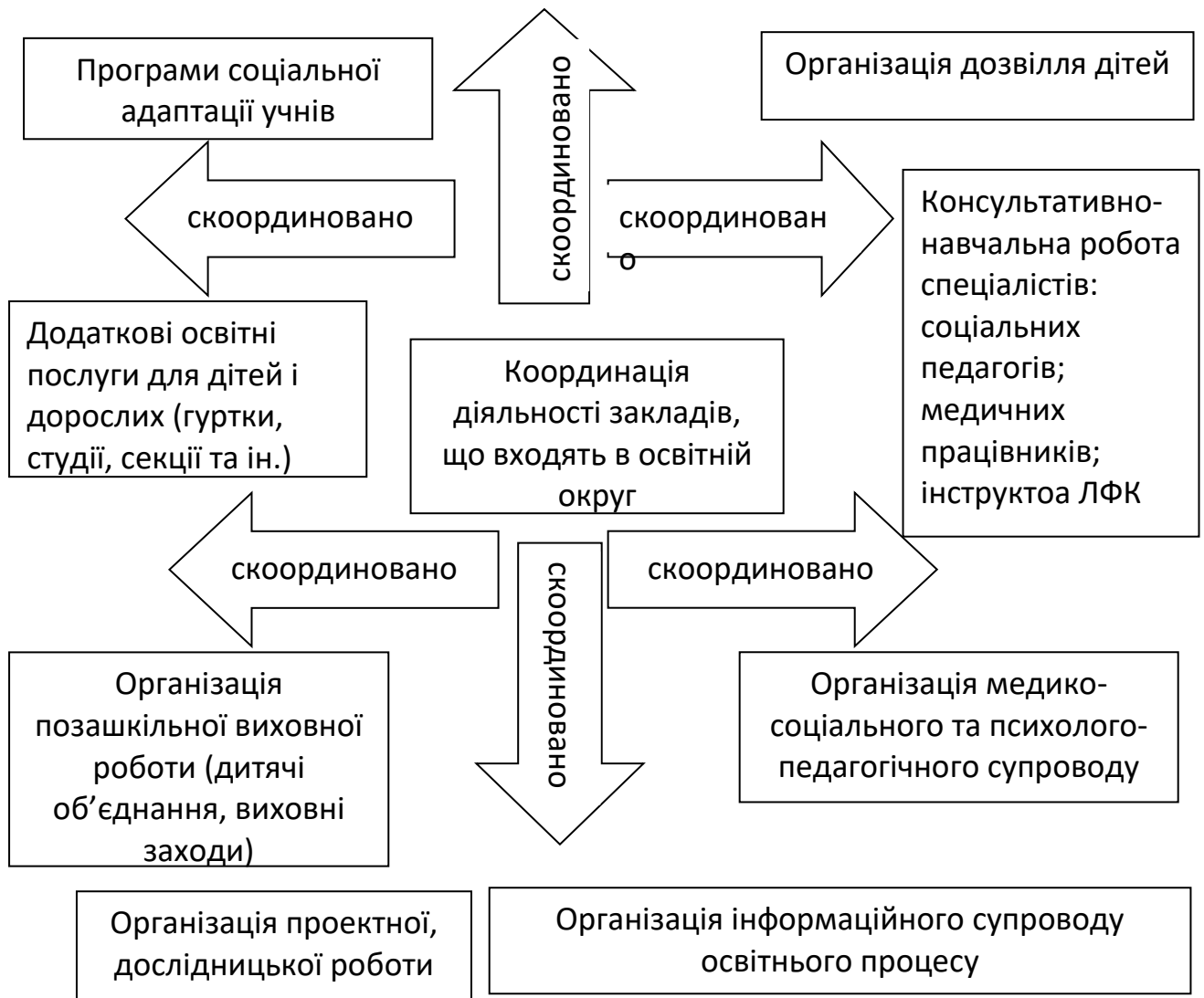
Рис.2. Напрямки координації діяльності закладів освітнього округу

З Положення «Про освітні округи» можна вибрати найголовніше, що [45,46]: