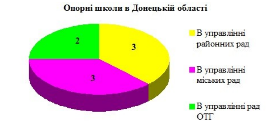
Рис.3. Опорні школи в Донецькій області

Тільки сьогодні, працюють 2 опорні школи області і перебувають в управлінні рад ОТГ. Інша частина опорних шкіл управляється міськими радами. Відмінною рисою Донецької області є висока урбанізація регіону, зменшення інтенсивними темпами населення в містах обласного значення. В більшості областей в сільській місцевості створюються опорні школи [47,54].