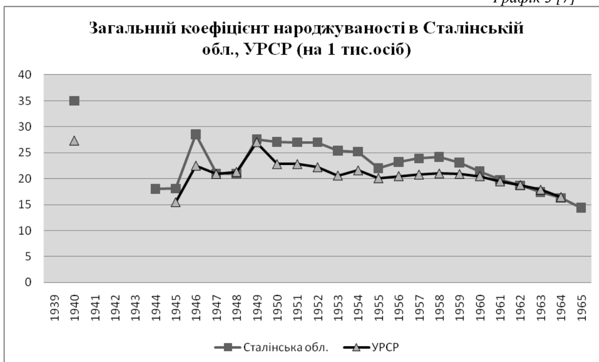
Графік 3 [7]

З графіка 3 видно, що потужне підвищення рівня народжуваності, котре спостерігалось у 1946 р., виявилось короткочасним. Вже наступного 1947 р. загальний коефіцієнт народжуваності знизився по УРСР на 7,1%, по Сталінській області на 25,3%. Можна зробити попередній висновок про те, що на Донеччині вплив Голодомору на народжуваність був сильнішим, ніж по Україні загалом. У 1949 р. стався широко розрекламований у періодичній пресі сплеск народжуваності. Отже, внаслідок Голодомору 1946–1947 рр. компенсаційна хвиля повоєнних народжень була перервана і набула вигляду двогорбої. Вершинами компенсаційних народжень були 1946, 1949 рр. Жодного року показники народжуваності не перевищили довоєнну відмітку. На відміну від західних країн, ні населення регіону, ні України загалом «бебі буму» не зазнало.