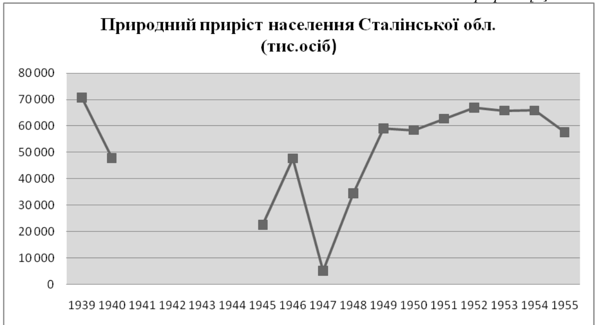
Графік 1 [5]

Для того, аби виявити регіональні відмінності демографічних процесів на територіях, чисельність населення яких є нерівнозначною, в демографії прийнято вираховувати показники на кожну тисячу населення (проміле) [3]. Проаналізувати загальний коефіцієнт природного приросту можна за допомогою Графіку 2.