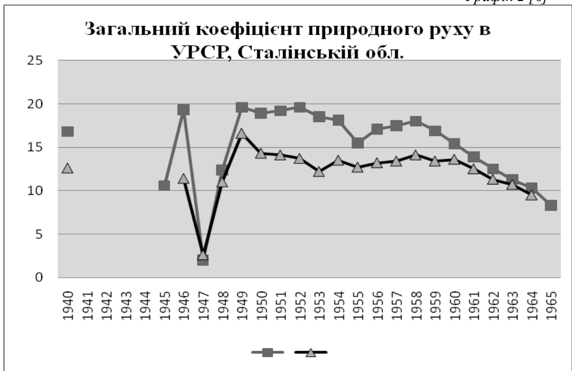
Графік 2 [6]

Графік 2 демонструє різкий зріст показників у повоєнному 1946 р., глибоке падіння у 1947 р., стрімке зростання у 1948–1949 рр. Починаючи з 1950 р., коли можна говорити про певну соціально-демографічну стабілізацію після кризи 1947 р.,