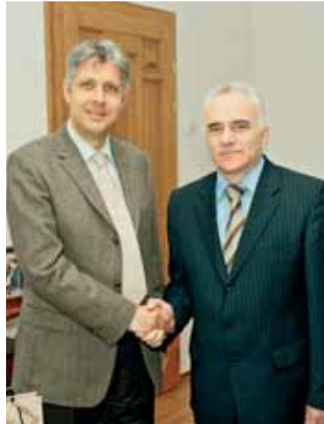
Οι Πρυτάνεις των Πανεπιστημίων της Μαριούπολης και Κύπρου, μετά την υπογραφή της διμερούς Συνεργασίας

Το ΚΠΑΣΜ συμμετέχει ενεργά στην προσπάθεια για υλοποίηση της Σύμβασης της Μπολόνια, ενώ συγκαταλέγεται ανάμεσα στα 14 από τα 245 ΑΕΙ της Ουκρανίας που μαζί με περισσότερα από 500 πανεπιστήμια της Ευρώπης έχουν υπογράψει τη Magna Charta Universitatum, ένα είδος συντάγματος της σύγχρονης ανώτερης παιδείας στην Ευρώπη. Για το συντονισμό των δραστηριοτήτων των πανεπιστημίων στο πλαίσιο της Σύμβασης της Μπολόνια έχει δημιουργηθεί ένα Συμβούλιο από πρυτάνεις και διακεκριμένους ακαδημαϊκούς. Στις 19 Ιουνίου 2005 το Συμβούλιο αυτό συνήλθε για πρώτη φορά στην Ουκρανία, στο ΚΠΑΣΜ. Συμμετείχαν οι καθηγητές F. Roversi-Monaco, πρόεδρος του Συμβουλίου, πρώην πρύτανης του Πανεπιστημίου της Μπολόνια, L. Smith (Πανεπιστήμιο του αΟαλο), J. Bricall, πρώην πρόεδρος του Δικτύου Ευρωπαϊκών Πανεπιστημίων (Πανεπιστήμιο της Βαρκελώνης), A. Barblan, γενικός γραμματέας του Συμβουλίου (Ελβετία) και άλλοι επιστήμονες, συντάκτες και ιδρυτές της Σύμβασης της Μπολόνια. Οι συμμετέχοντες εκτίμησαν και αξιολόγησαν τον υψηλό βαθμό δραστηριότητας του Πανεπιστημίου στην κατεύθυνση της προετοιμασίας ειδι-