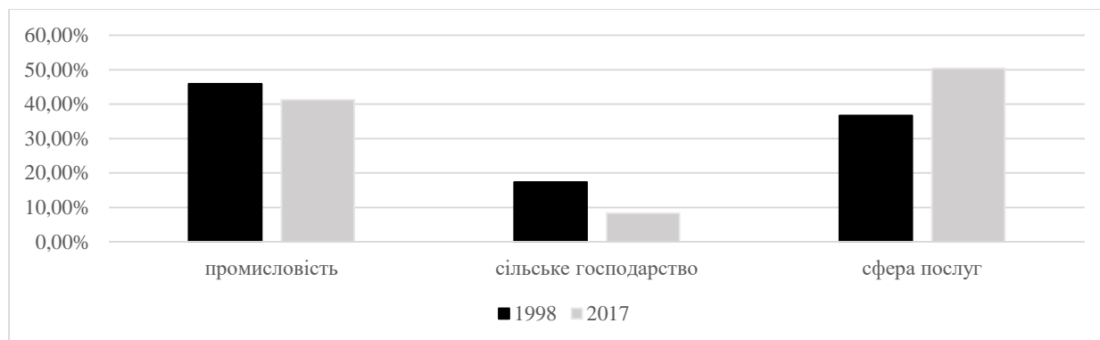
Рис.2 Динаміка співвідношення промисловості, сільського господарства та сфери послуг в КНР за 20 років

Економіка Китайської Народної Республіки процвітає завдяки грамотній зовнішній політиці. Велика частина продукції, що випускається, спочатку виготовляється для експорту в інші країни. Практично половину світового експорту здійснює Китай, що дозволяє країні займати перше місце на світовому ринку. Активно відправляються на експорт метали, що дозволяє заводам працювати в інтенсивному графіку, текстиль та одяг. Китай має більше 182 партнерів у світі. Торгівля з Японією, США і Західною Європою становить 55% товарообігу. Завдяки зовнішній торгівлі країна отримує 80% валютних доходів.