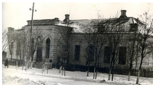
С. Мангуш. Здание бывшего волостного правления, в котором в 20-ые годы располагался Мангушский районный исполнительный комитет

Продолжали поступать в различные инстанции и письма недовольных сельчан. Жители Ялты сетовали на непролазную грязь, отсутствие тепла в помещениях учреждений, грубость их работников и на многое другое. В этом перечислительном ряду указывались и гораздо серьезные недостатки. Более сокрушительной дискредитации Ялты как районного центра быть не могло.