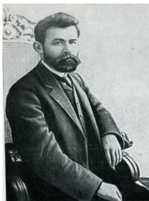
Председатель ВУЦИК Григорий Иванович Петровский

Известно, что в траурные дни января 1924 года, вызванные смертью В.И. Ленина, на митинге в Ялте выступил видный советский государственный и партийный деятель, председатель Всеукраинского ЦИК Григорий Иванович Петровский, часто бывавший в Приазовье. На греческом языке перед многочисленной толпой говорил председатель районного исполнительного комитета Петр Иванович Богадица, назначенный в Ялту с должности председателя Сартанского волисполкома. Между Петровским и Богадицей состоялась длительная беседа. Ее результатом, вполне возможно, и стало решение ВУЦИК и Совета народных комиссаров Украины от 19 ноября 1924 года перенести центр Мангушского района из Мангуша в Ялту, сохранив старое наименование района. Таким образом, повторялось распоряжение Центральной административно-территориальной комиссии от 15 января 1923 года только в части перевода районного центра в Ялту, но при этом оставалось прежнее наименование района – Мангушский. Подобное «новшество» еще больше запутало ситуацию. Чехарда с названием продолжалась. Чаще всего в документах указывался Ялтинский район, хотя ВУЦИК настаивал на выполнении своего последнего постановления, грозя перенести районный центр вновь в Мангуш. Президиум Донецкого губисполкома вынужден был просить ВУЦИК, как записано в протоколе заседания 21 февраля 1925 года, «пересмотреть свое постановление, указав, что центром района в течение 2-х лет является Ялта и что перенесение районного центра в Мангуш совершенно нецелесообразно».