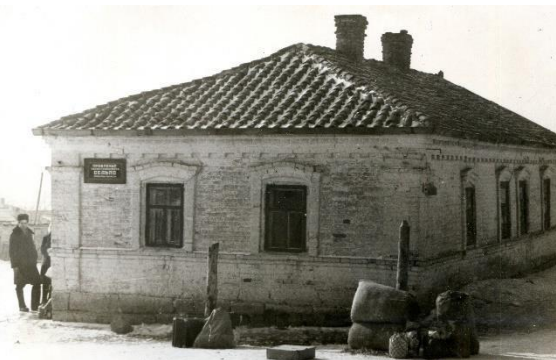
с. Мангуш. Здание районного