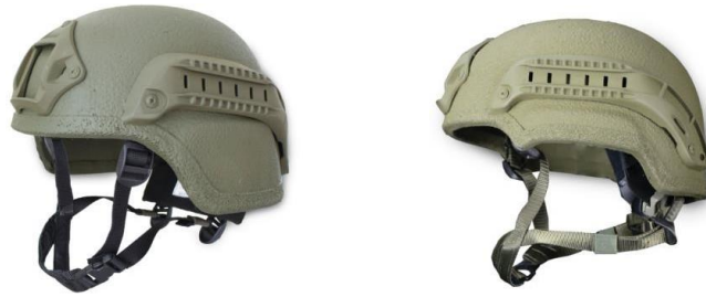
тип "F" тип "С"