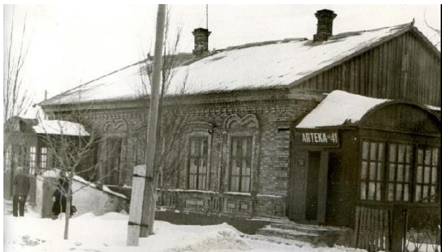
с. Мангуш. В этом здании в 20-ые годы потребительского общества находилось районное отделение комнезама

Пытаясь уладить затянувшуюся тяжбу, ВУЦИК в том же году прислал комиссию, которая должна была определить место нахождения районного центра. Комиссию разделили на две группы: одна обследовала состояние дел в Мангуше, а другая – в Ялте. Когда после окончания работы стали подводить итоги, выяснилось, что комиссия, находящаяся в двух селах, пришла к одному заключению: и Мангуш, и Ялта вполне могут быть районными центрами. После отъезда представителей ВУЦИК все осталось по-прежнему. Районное земельное управление, райинспектура по народному образованию, отделение комнезама, районное потребительское общество находились в Мангуше, а финотдел, здравотдел, отдел политпросвета – в Ялте. Район, как и раньше, называли и Мангушским, и Ялтинским.