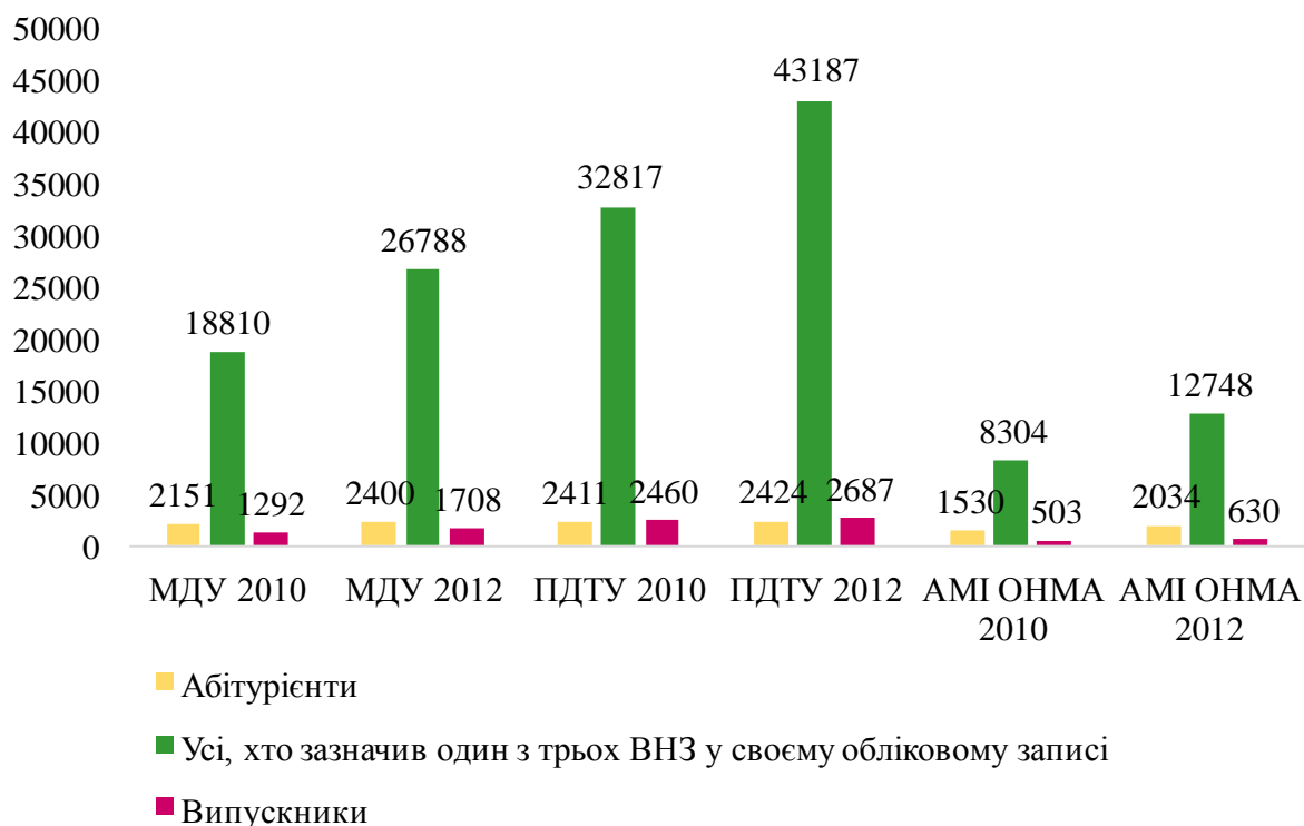
Рис. 1 Наявність випускників, діючих та потенційних студентів ВНЗ м. Маріуполь, зареєстрованих у соціальній мережі «ВКонтакте».

дослідження становлять три найбільші вищі навчальні заклади м. Маріуполь: Приазовський державний технічний університет (ПДТУ), Маріупольський державний університет (МДУ) та Азовський морський інститут Одеської національної морської академії (АМІ ОНМА).