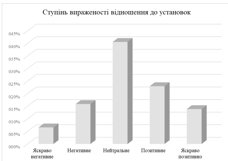
Рис. 2. Розподіл респондентів за ступенем вираженості відношення до різноманітних установок

Такою ж яскравою особистістю є те, що напевно саме усвідомлення різноманітних установок, стереотипів та робота над цим є важливим компонентом на шляху формування власного ефективного міфу.