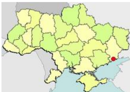
η θέση της Μαριούπολης