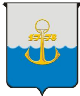
το έμβλημα της Μαριούπολης

Η Μαριούπολη είναι πόλη της Ουκρανίας με πληθυσμό 500.000 κατοίκους, και λιμάνι στη Θάλασσα Αζόφ (Αζοφική θάλασσα).