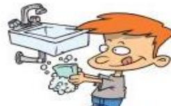
sich (D) die Hände abwaschen