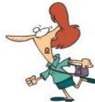
zur Arbeit gehen (fahren)