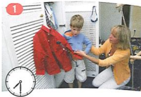
Um 7:30 Uhr hat sie den Sohn angezogen.