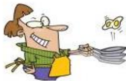
das Frühstück machen (vorbereiten)