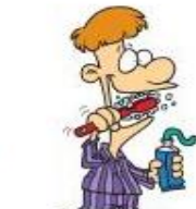
die Zähne putzen [bürsten, reinigen]