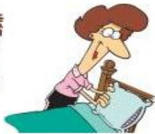
das Bett machen