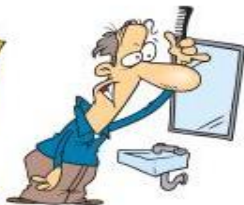
die Haare machen