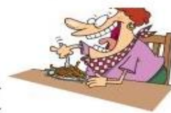
frühstücken (zu Mittag/Abend essen)