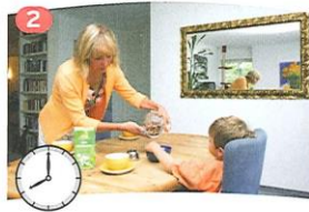
Um 8 Uhr hat sie ...