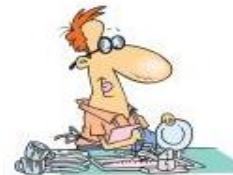
abwaschen/ das Geschirr waschen