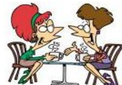
die Arbeitspause haben/ sich mit den Freunden treffen