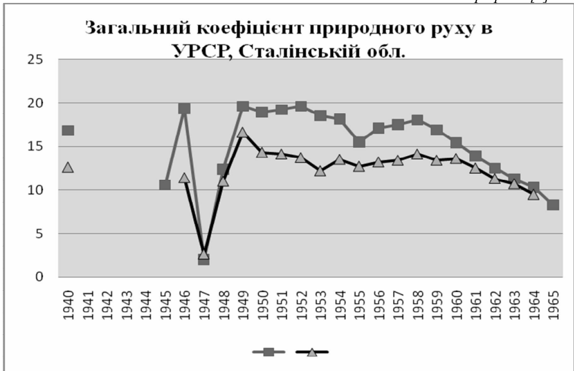
Графік 2 [6]

Графік 2 демонструє різкий зріст показників у повоєнному 1946 р., глибоке падіння у 1947 р., стрімке зростання у 1948–1949 рр. Починаючи з 1950 р., коли можна говорити про певну соціально-демографічну стабілізацію після кризи 1947 р.,