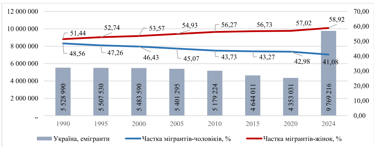
Рис. 1. Кількість емігрантів з України, 1990-2024 рр.

До 2022 року Україна демонструвала стійку еміграційну спрямованість, що формувалася під впливом диференціації рівнів доходів, можливостей зайнятості та якості життя між Україною та країнами Європейського Союзу. За оцінками міжнародних організацій, чисельність українських мігрантів за кордоном у довоєнний період становила 5–6 млн осіб (UN DESA, 2023). Водночас після початку повномасштабної війни масштаби зовнішньої міграції різко зросли і станом на 2024 рік досягли близько 9,8 млн осіб, що є безпрецедентним показником за весь період незалежності (рис. 1).