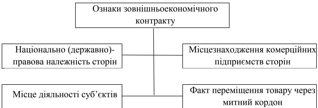
Рис. 1. Кваліфікуючі ознаки зовнішньоекономічного контракту

Необхідність визначення чітких ознак та критеріїв зовнішньоекономічності договору зумовлена тим, що статус зовнішньоекономічного договору передбачає особливий правовий режим, зокрема, з погляду оподаткування, митного оформлення, строків розрахунків тощо. Нормативно-правове регулювання зовнішньоекономічних контрактів передбачає цілу низку правил і вимог з боку як міжнародного так і національного законодавства, недотримання чи невиконання яких може призвести до застосування юридичних санкцій та значних економічних втрат.