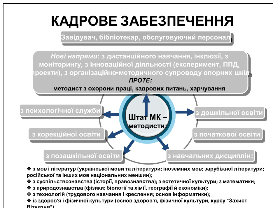
Рис. 2. Кадрове забезпечення методичного кабінету (центру) [4].

Для здійснення зазначених завдань у штаті методкабінету (центру) передбачено такі посади методистів (рис. 2). При цьому Положенням [4] визначено право завідувача (директора) вносити пропозиції засновнику щодо створення у складі методкабінету (центру) відділів, лабораторій, центрів, секторів та інших структурних підрозділів (п. 4.4) та зміни відповідної чисельності працівників (п. 4.5.1).