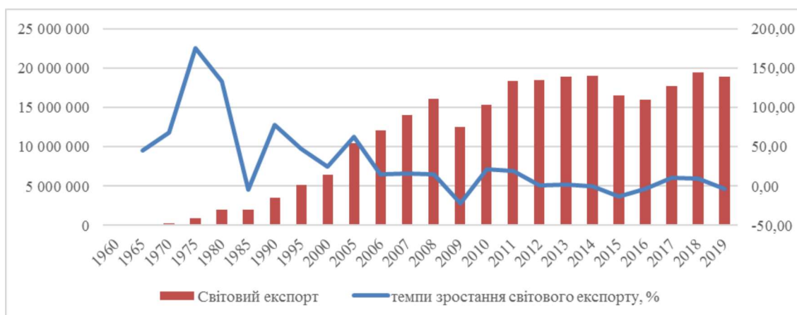
Рис.1. Динаміка світового експорту, млрд.дол.США (1960-2019 рр.) розраховано на підставі [8]

Також поясненням є все частіше звертання країн світу до протекціоністських заходів у міжнародній торгівлі з метою стабілізації національних економік. Ризики розвитку глобальної торговельної системи продовжують актуалізуватися через підвищене загальне політичне та торговельне протистояння між Китаєм і США, економіки яких є найбільшими у світі і дії та рішення яких здійснюють вплив на поточний стан торговельних відносин інших країн світу.