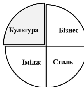
Рис. 3. Біхевіористична школа управління фірмовим стилем організації