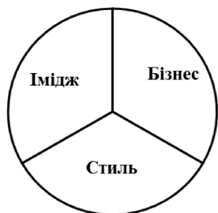
Рис. 2. Стратегічна школа управління фірмовим стилем організації

Основними фігурами в розвитку поняття фірмового стилю були Бернштейн, Балмер, Кеннеді та інші. За період 1950 року до нашого часу фірмовий стиль став невід'ємною частиною діяльності у будь-якій сфері бізнесу та зміцнив позиції в менеджменті, з'являється велика кількість дисциплін пов'язаних із дизайном та фірмовим стилем. У цей період виникає чотири основних теоретичних підходи (рис. 2 – 5), кожен з яких розкриває один з аспектів загального управління фірмовим стилем.