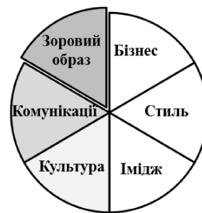
Рис. 5. Візуальна школа управління фірмовим стилем організації