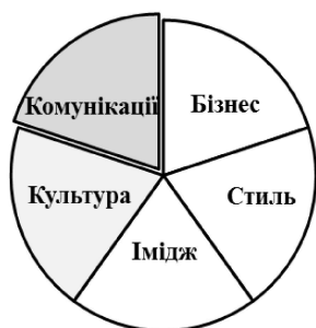
Рис. 4. Школа загальних комунікацій управління фірмовим стилем організації