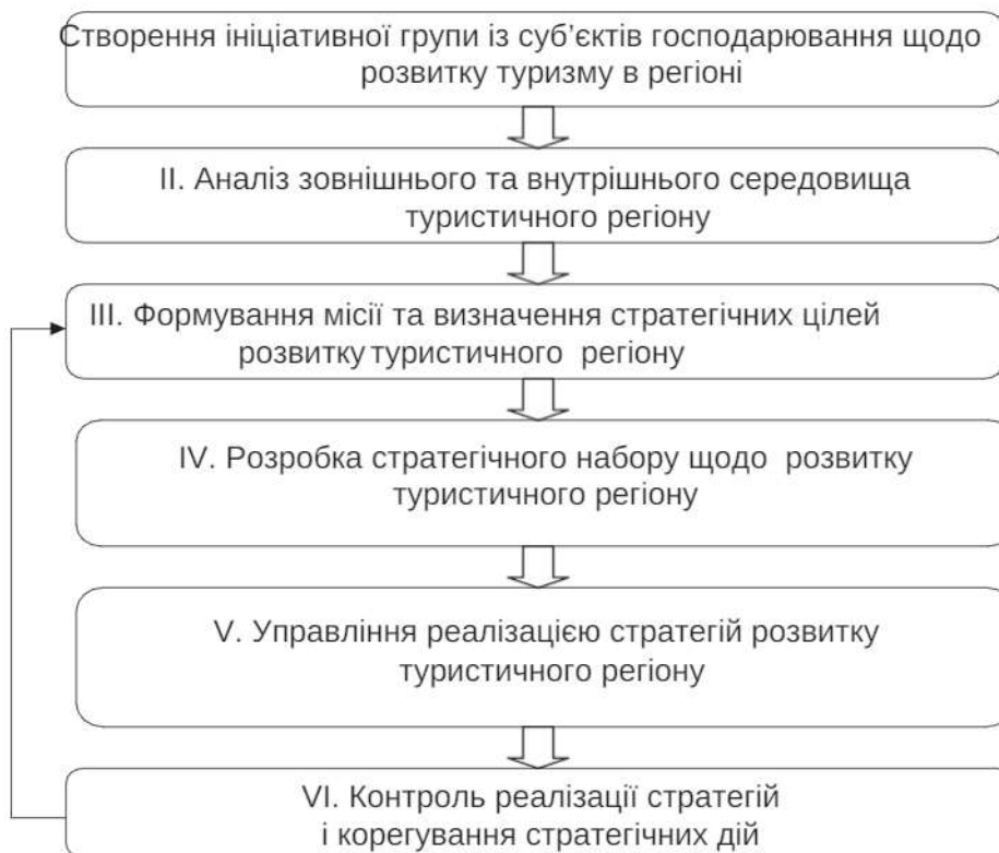
Рис. 2. Модель стратегічного управління розвитком туристичного регіону

В результаті дослідження було проаналізовано і узагальнено фактори, що гальмують сталий розвиток туризму в Приазов'ї, зокрема: недостатній рівень використання наявних ресурсів; низький рівень розвитку туристичної інфраструктури; недостатньо розвинена транспортна мережа між населеними пунктами регіону. Встановлено, що