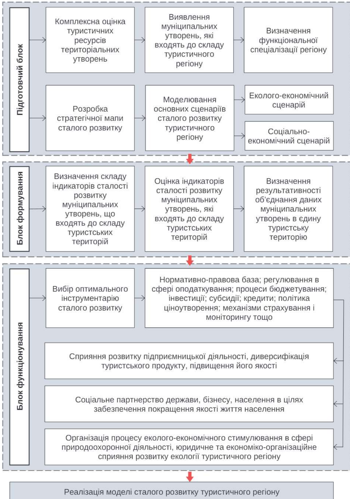
Рис. 3. Функціонально-логічна модель стратегічного управління розвитком туристичного регіону на засадах сталого розвитку